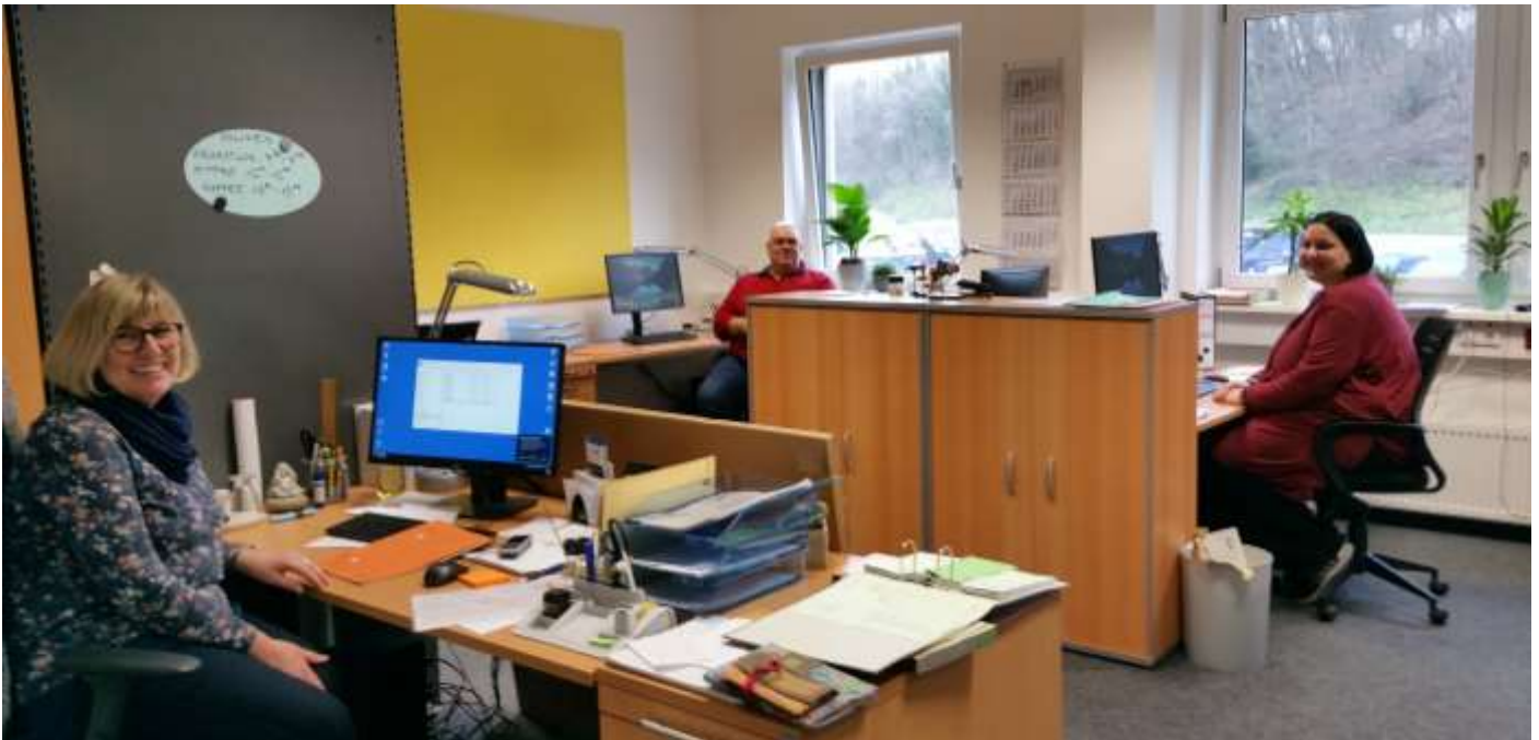
Am 1. Februar 2018 hat der Büro-Service der Fliedner Werkstätten seine Arbeit aufgenommen

Werkstätten sind Ansprechpartner für alle Menschen, die sich beruflich orientieren wollen: für Menschen mit geistigen Behinderungen, für Menschen mit psychischen Beeinträchtigungen, für arbeitslose Menschen. „Unsere Aufgabe als Fliedner Werkstätten ist es, Menschen mit ihren Fertigkeiten und Interessen zu begleiten und zu unterstützen und ein möglichst passendes Angebot zu finden.“