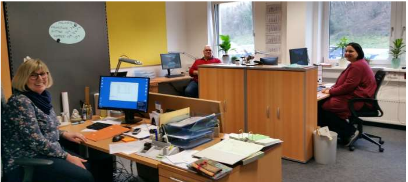
Am 1. Februar 2018 hat der Büro-Service der Fliedner Werkstätten seine Arbeit aufgenommen

Mülheim an der Ruhr, 2018-02-15 (pdf). Seit über 50 Jahren engagieren sich die Fliedner Werkstätten für die Teilhabe von Menschen mit Behinderungen am Arbeitsleben - an verschiedenen Standorten in Mülheim und in unterschiedlichen Bereichen wie Schreinerei, Verpackung, Garten- und Landschaftsbau, Elektro-Montage und vieles mehr. Am 1. Februar ist eine neuer Bereich hinzugekommen: der Fliedner Büro-Service.