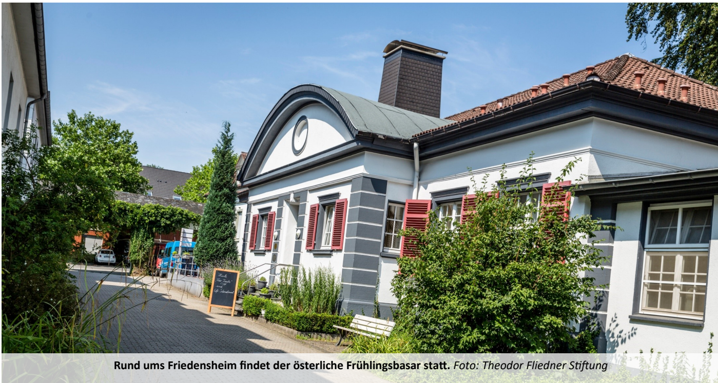
Rund ums Friedensheim findet der österliche Frühlingsbasar statt.

Am 17. und 18. März heißt es stöbern und entdecken—Erlöse sollen Outdoor-Sportgerät finanzieren