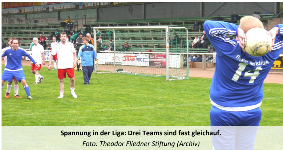
Spannung in der Liga: Drei Teams sind fast gleichauf.

Die Solinger Gastgeber machen sich ebenfalls berechtigte Hoffnungen auf den Ligasieg 2018 und holten insgesamt 11 Punkte, genauso viele wie der Tabellenführer aus Mülheim. Stark aufgespielt hat ebenfalls das Team des Haus Hermann Josef aus Köln. Mit sehr guten Einzelspielern erkämpften sie sich sehr gute 10 Punkte und