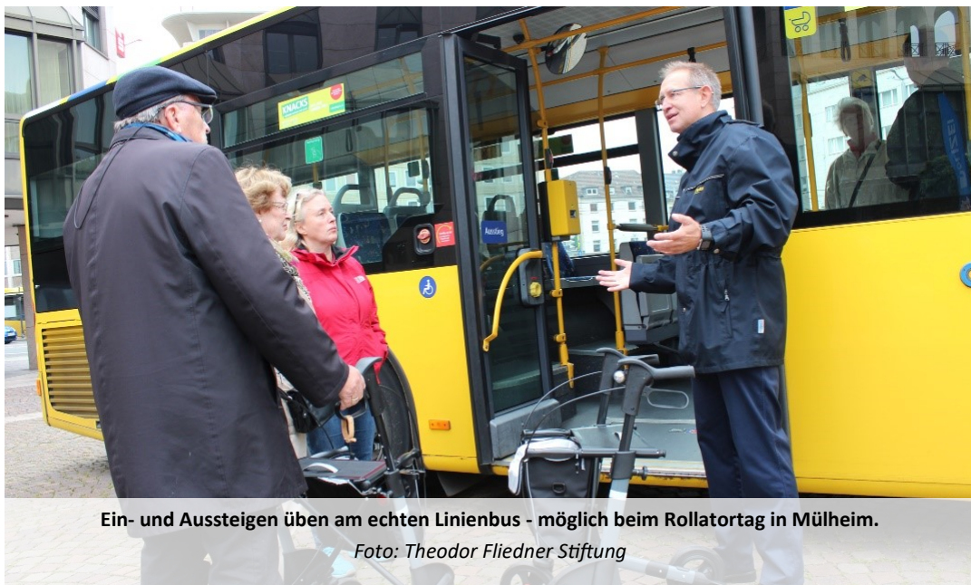
Ein- und Aussteigen üben am echten Linienbus - möglich beim Rollatortag in Mülheim.

Der Physiotherapeutin im Dorf ist die Sicherheit der älteren Mülheimer ein hohes Anliegen. Daher freut sie sich auch über die Unterstützung weiterer Partner. So wird die Polizei wieder mit einem Rollator-Parcours vor Ort sein. Das Sanitätshaus Reha