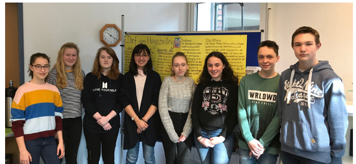
Schülerinnen und Schüler der Georg-Müller-Gesamtschule aus Wetter besuchten die Senioreneinrichtung in Gevelsberg.