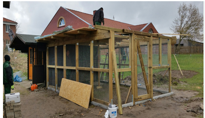
Fliedner Werkstätten im Einsatz: Holz für Holz entsteht das neue Gehege für die bald kommenden Hühner.

Nun gibt es weiteren tierischen Zuwachs. Möglich gemacht wurde der Bau des Hühner-Areals nicht nur durch Spenden, sondern auch durch fachliche Unterstützung: „Der Rassegeflügelzuchtverein Mülheim-Saarn hat uns toll beraten und uns schließlich die ersten fünf Hühner geschenkt“, freut sich Projektleiterin Inken Bolten. Und so ziehen die ersten „Sundheimer“ und „Barnevelder“ Anfang April in ihr neues Haus im Fliednerdorf. „Unse-