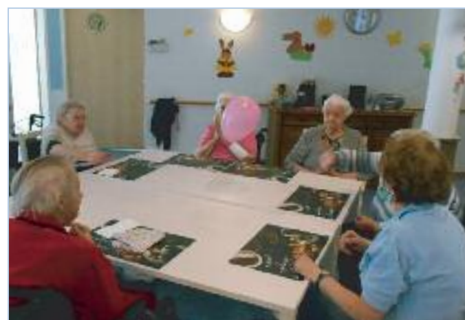
Entspannung beim Distanzball spielen