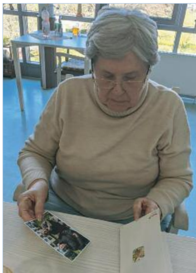
Ostergrüße an die Angehörigen