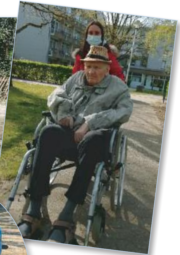
Frühlingssonne in unserem Park genießen