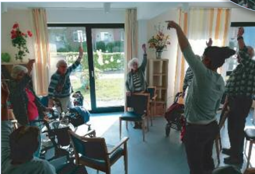
Fit werden mit dem Kraft- Balancetraining