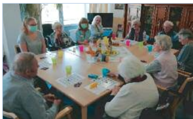
Bingospielen geht immer