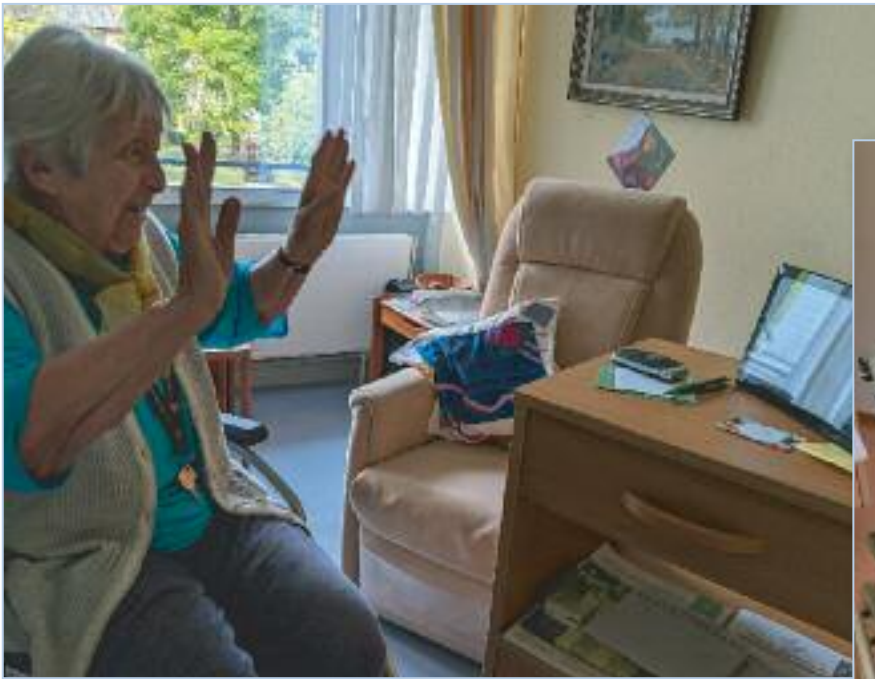
Videochat mit den Angehörigen