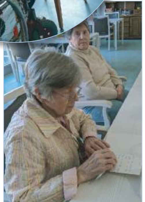
Post von den Lieben