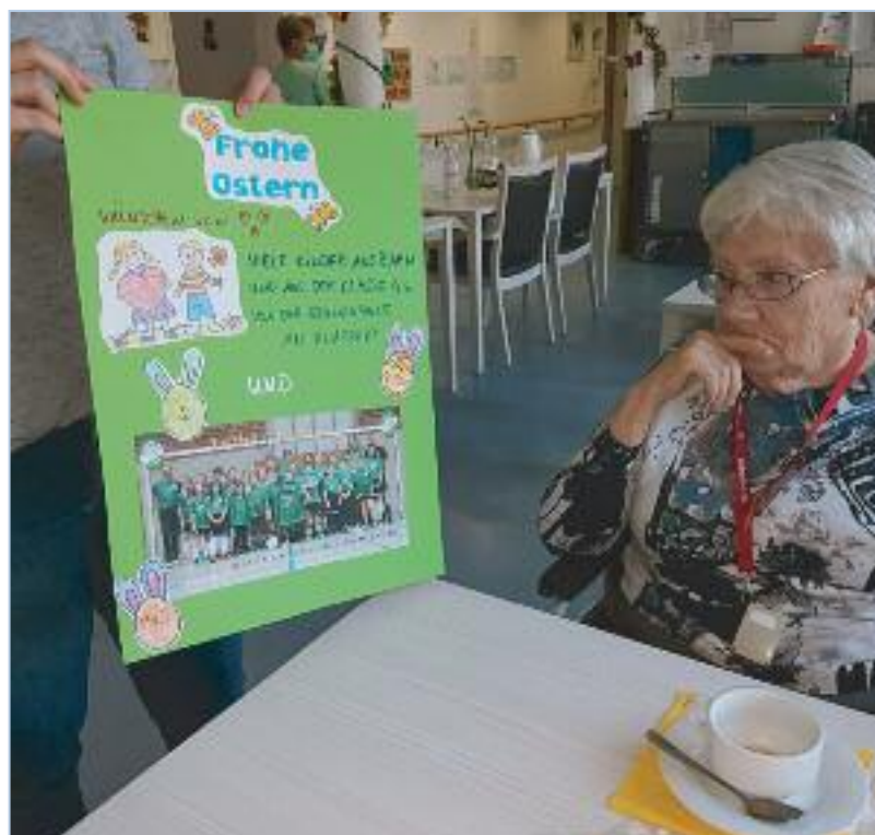
Grundschulkindern schicken Ostergrüße