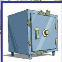
der Tresor, -e der Geldschrank, -"-e