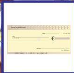
der Scheck, -s