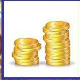
die Münze, -n