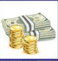
das Geld, -er