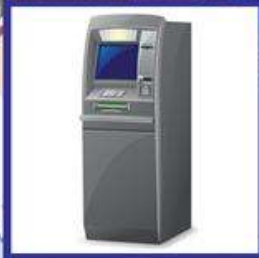
der Bankomat, -en der Geldautomat, -en