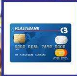
die Bankomatkarte, -n