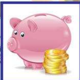
das Sparschwein, -e