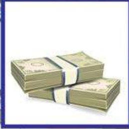
der Geldschein, -e