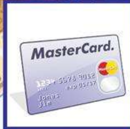
die Kreditkarte, -n