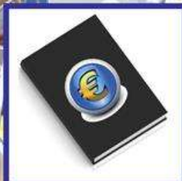
das Sparsbuch, -"-er