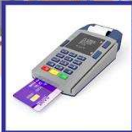
das Kartenlesegerät, -e