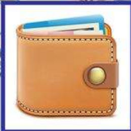
die Geldtasche, -n