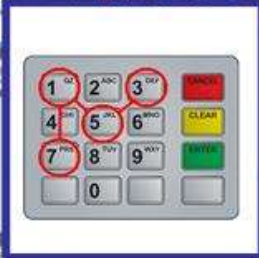
der PIN-Code, -s