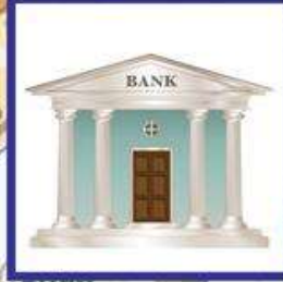
die Bank, -en das Geldinstitut, -e